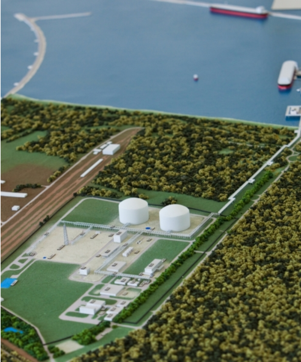
Makieta terminalu LNG i portu zewnętrznego w winoujciu