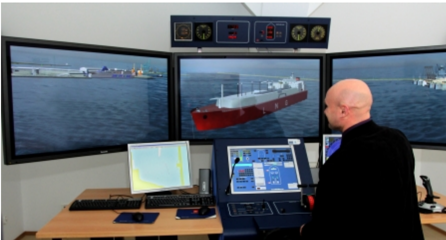
Symulator działający na Akademii Morskiej w Szczecinie